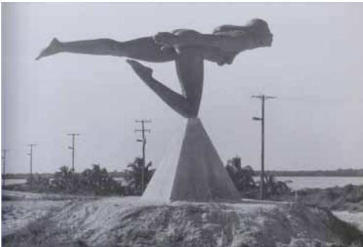
Cancún, Quintana Roo, México. Tomado de Helen Escobedo (coord.), Monumentos...