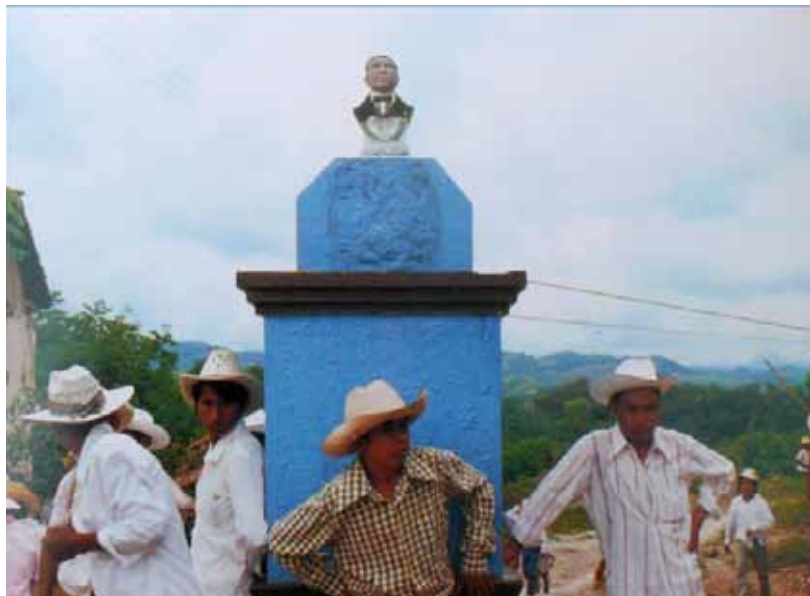
Monumento a Benito Juárez en Cuetzalan, Puebla, México. Tomado de Helen Escobedo (coord.), Monumentos...