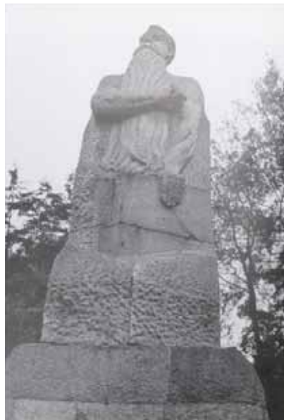
Venustiano Carranza representado como Moisés, Toluca, Estado de México.