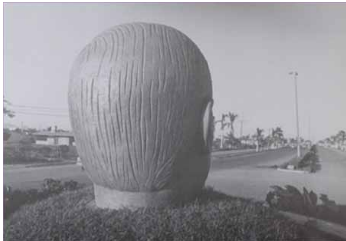
Cabeza de Juárez en Mexicali, Baja California, México.