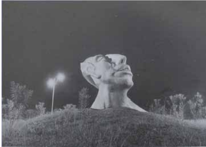
Palenque, Chiapas, México. Tomado de Helen Escobedo (coord.), Monumentos...