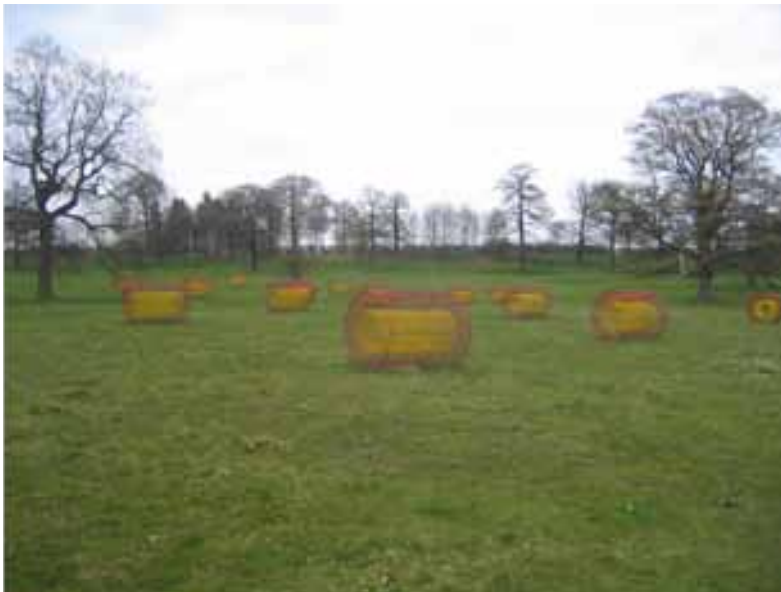
Helen Escobedo, Campos veraniegos , 2008.