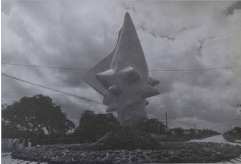
Monument al Caracol, Cozumel, Quintana Roo, México. Tomado de Helen Escobedo (coord.), Monumentos...