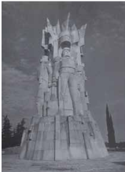
Héroes de la Independencia en Dolores Hidalgo, Guanajuato, México. Tomado de Helen Escobedo (coord.), Monumentos...