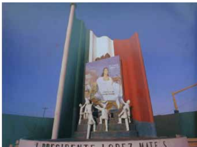
Monumento al Libro de Texto Gratuito, Tijuana, Baja California, México. Tomado de Helen Escobedo (coord.), Monumentos...