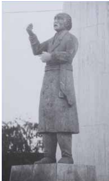
Monumento a Miguel Hidalgo en Poza Rica, Veracruz, México.